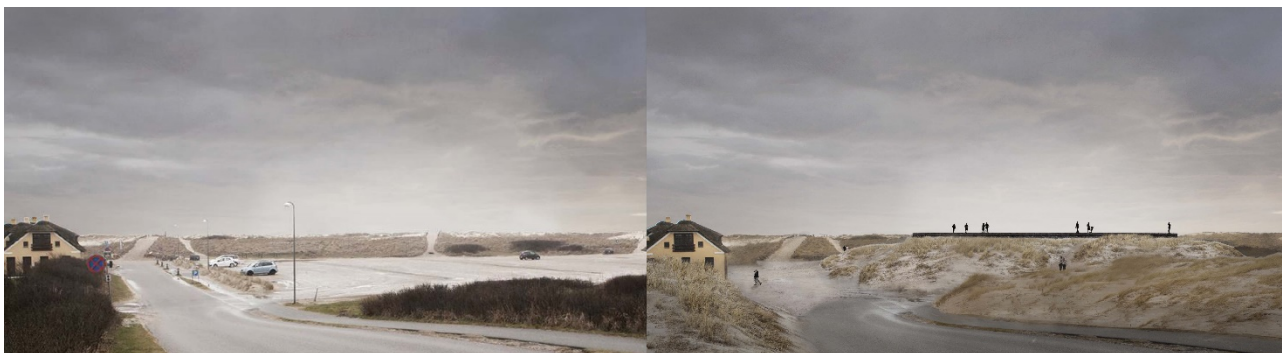
Visualisering før og efter etablering af Det Blå Plateau og klitlandskab omkring ved den eksisterende p-plads.

Lokalplanen fastlægger, at boardwalken skal være hævet 0,3m over terræn, så klitlandskabet kan bevare sine dynamiske formationer. Hjælme og andre plantearter kan således fortsat sprede sig.