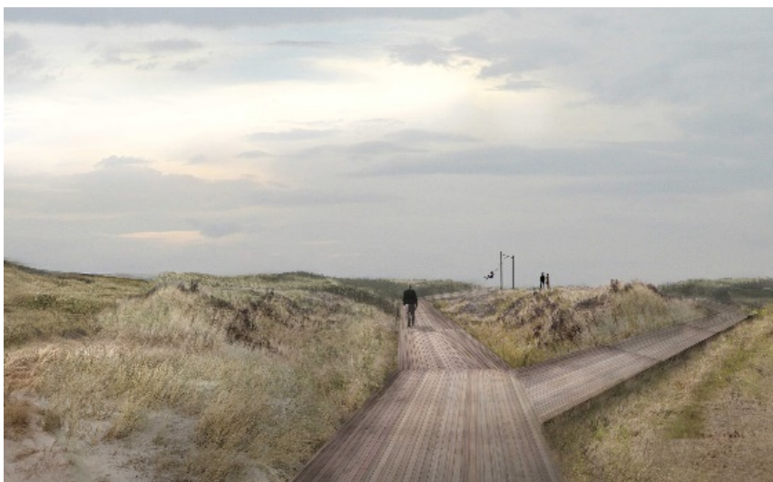
Visualisering af boardwalk, som følger landskabets topografi.

De offentligt tilgængelige funktioner samles i et anlæg, der fremstår som et gårdrum og dermed giver læ for vinden. Ved at koncentrere de offentlige funktioner friholdes det øvrige landskab til at opleve stedet og