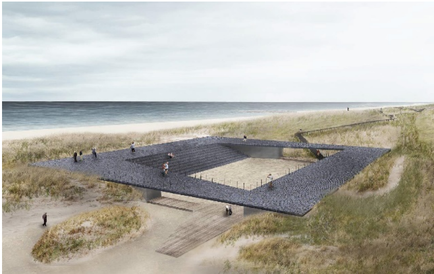
Visualisering af Det Blå Plateau, der viser landskabstilpasningen, hvor bebyggelsen er indbygget i terrænet.