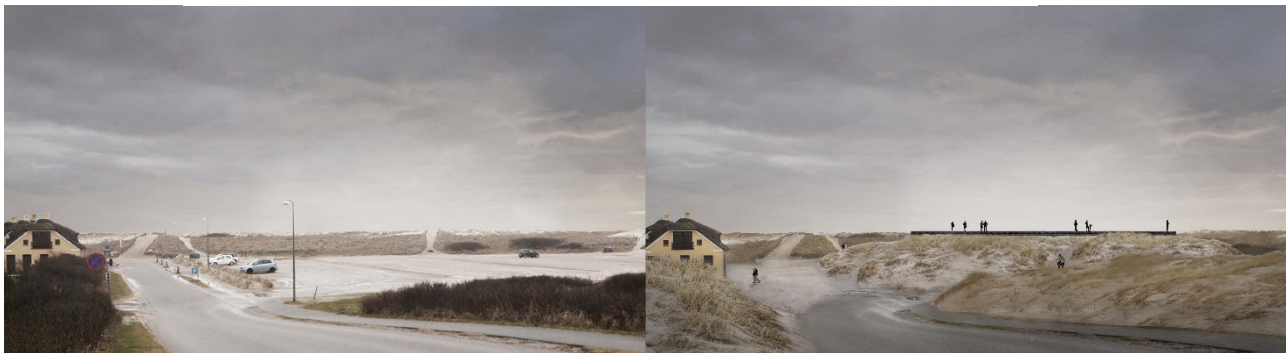
Visualisering og snittegning af Det Blå Plateau, der viser princippet for landskabstilpasningen.